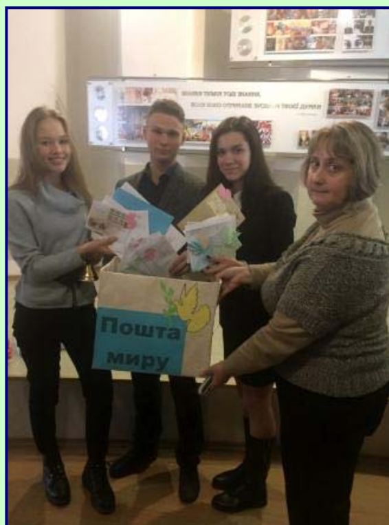
Редколегія «Газети КРОС»

Під час проведення заходу учасники конференції взяли участь в акції «Пошта миру», флешмобі «Дзвоники миру».